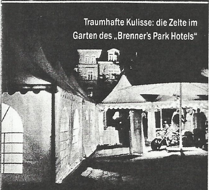
Traumhafte Kulisse: die Zelte im Garten des „Brenner's Park Hotels“